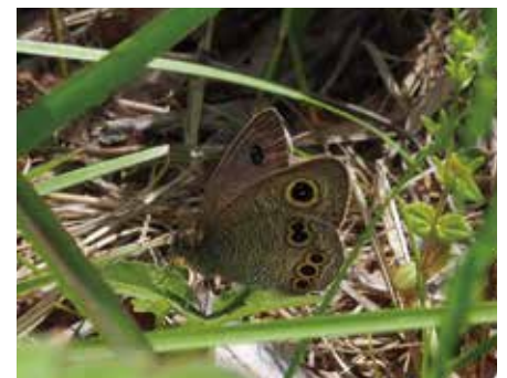
ヒメウラナミジャノメ