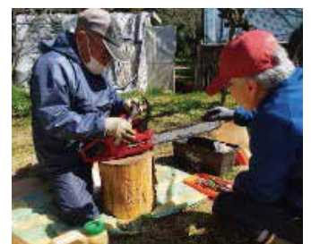
写真7 チェーンソーのメンテナンス

また、日頃使っている機材のメンテナンスも行った。写真はチェーンソーのチェーンのたるみを調整しているところである。