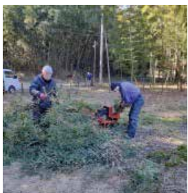
写真4 枝・端材の処理

第1回目は、ムジナの里で竹林（孟宗竹）の間伐を行った。間伐した竹の主要部分は炭焼き用として使うため約2.4mに切断し、切り落とした枝、先端の端材はシュレダーで細かく切断し、竹林に戻した。間伐後はすっきりした様子となっている。