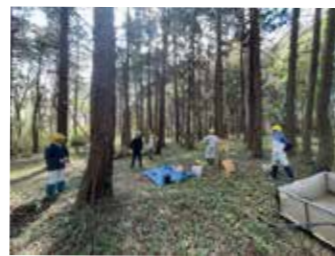
作業の準備をする様子

5~6月は下記の通り4回の実施を予定しております。雑木林、杉林の景観維持へのご協力を引き続き宜しくお願いいたします。