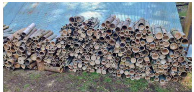
写真6 切断しまとめた炭焼き用材料

第1回目はムジナの里で収穫した約2.4mの竹材を次回の炭焼き用に約40cmに切断し、束ねて保管した。