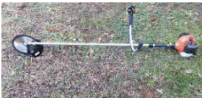
写真2 新しい刈払機

第2回目は、梅林の除草刈りを自走式草刈り機3台、刈払機3台で行い、さらに新規に購入した刈り払い機のお披露目を行った。また、梅林では梅の花が咲き初めており、春の足音が間近に感じられた。