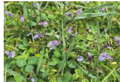
ムラサキサギゴケ