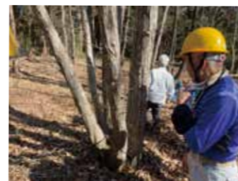
萌芽するコナラを確認する様子