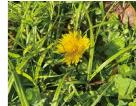
カントウタンポポ