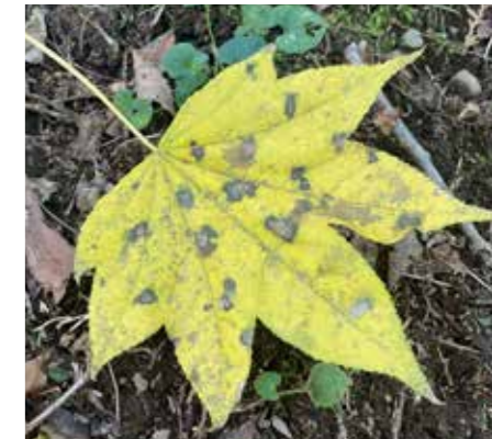
色づいたハリギリの葉