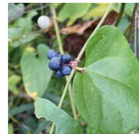
アオツブラフジの実