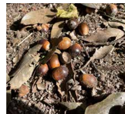
シラカシのどんぐり