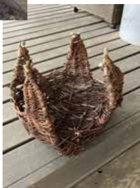
完成したツルカゴ