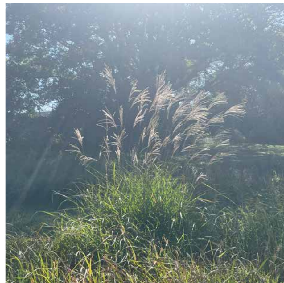
穂をつけるススキ