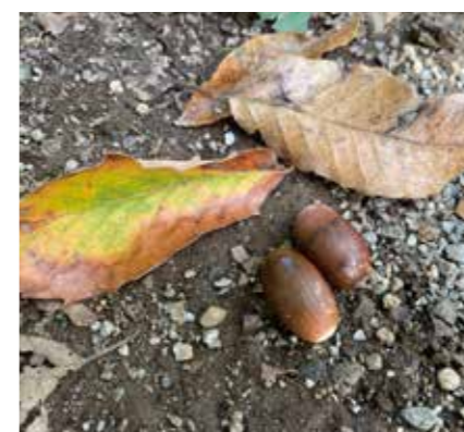
コナラのどんぐりと色づいた葉