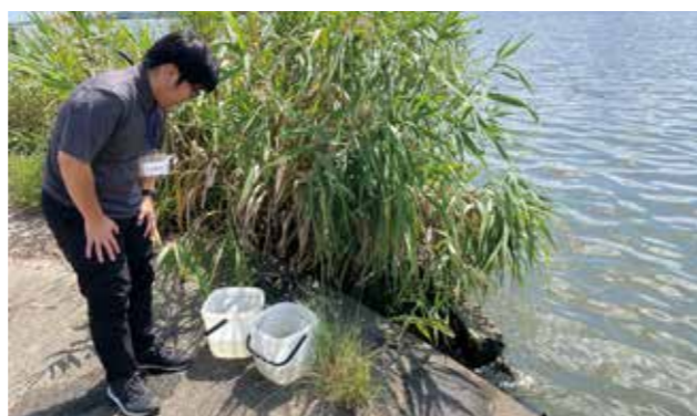
生態展示のためテナガビを捕獲する様子