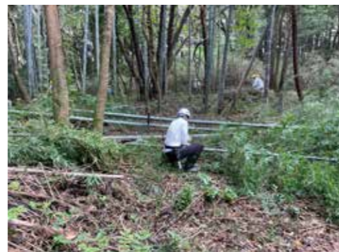
伐倒後、一定の間隔で切断していく様子