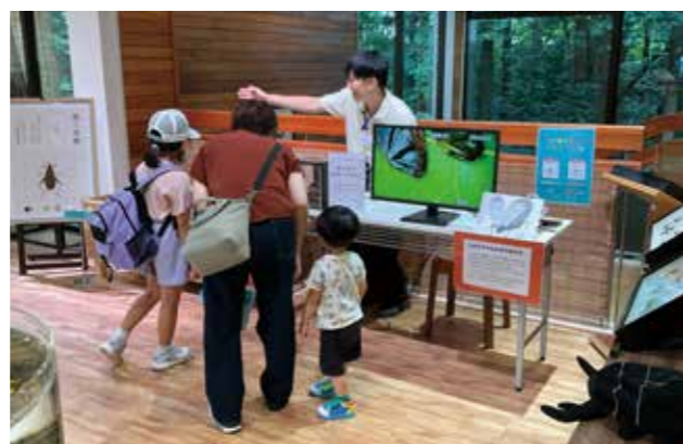
鳴く虫の音が出る仕組みを解説する様子

実習生の新鮮さや成長する意欲に職員も感化され、若い感性から新しい気づきも得られ職場全体が活性化したように思いました。来年度も引き続き受け入れを行ってきたいと思います。