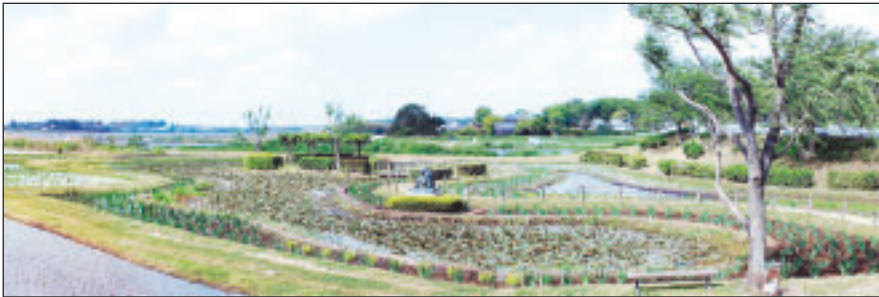
2,000本の補植が終わった牛久市観光アヤメ園全景