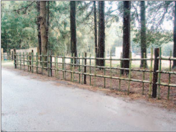
きれいに出来上がった竹柵

3月13日 ムジナの里 前回に引き続き四つ目垣づくり、全体の2/3を作った。 続きは来年度の持ち越し。杉林の林床整備。 3月19日～21日 木炭製作 春分の日を迎えてお墓参りもさせて頂いて炭焼き。 3月27日 ネイチャーセンター 今年度の実績を考えながら、みんなと来年度の計画つ くり。 記 飯田