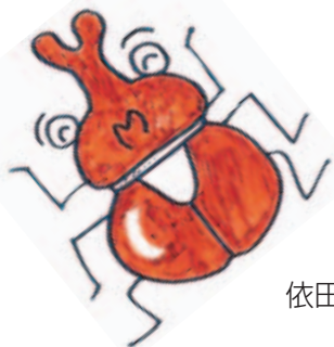
依田っちカブト(オス)

カブトムシの里親になってみませんか? 森のカブトムシを幼虫から育てて夏の雑木 林に放してあげましょう。昆虫好きの小学生集まれ!! 日時: 5月21日(土), 7月16日(土) 各日午前10時~12時(9:30集合) 場所: 牛久自然観察の森内の雑木林 対象: 小学生30名(保護者の方見学可能。子どもだけの 参加も可) 申し込み方法: 4月21日(木)午前9時より電話にて牛 久自然観察の森(電話029-874-6600)まで申込みく ださい。 参加費: 一人につき400円(保険料+資料代)、 会員は100円(資料代) 主催: NPO法人うしく里山の会、牛久自然観察の森