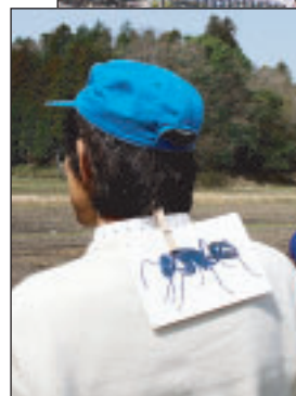
ネイチャーゲームで背中に 付けたアリの絵