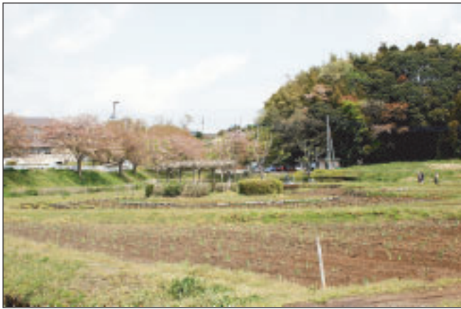
定点撮影に指定したアヤメ園

又小野川沿いの撮影場所の決定は次回例会（5月19日）にロケハンを行う予定です。（記 臼井）