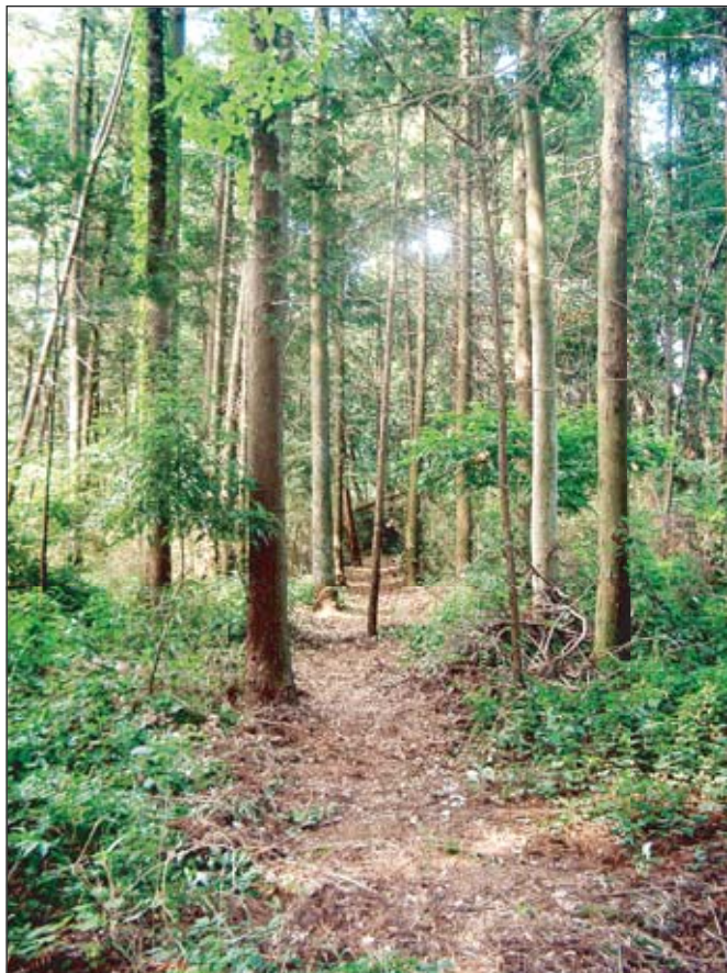
ムジナの里に道が開通、見事に切り開かれたこの道は「里山遺産・ムジナ古道」???

ネイチャーキッズから2家族、3人の参加であった、また機会があったら一緒に活動しましょうと終わった。 次回応援隊 8月8日 9時30分ムジナの里 記 飯田