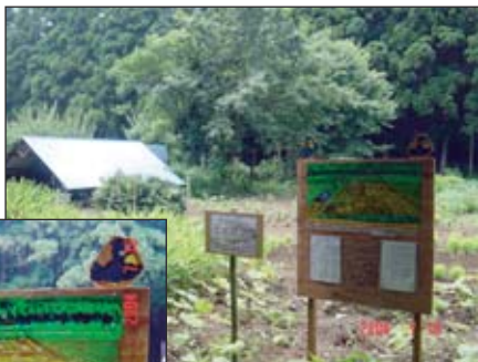
新しく立てられた看板

7月7日、雑木林の畑に会員手作りの案内板が設置されました。内容は作物の名称が主ですが、配布用のチラシも用意した案内板です。これまでも度々森の利用者に作物の名前を尋ねられましたが、これからは畑の活動日以外でも役立つ案内板になることでしょう。（記 小野寺）