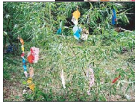
折り紙で創った七夕飾り