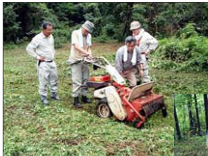
サンダーバード 草刈機Ⅰ号