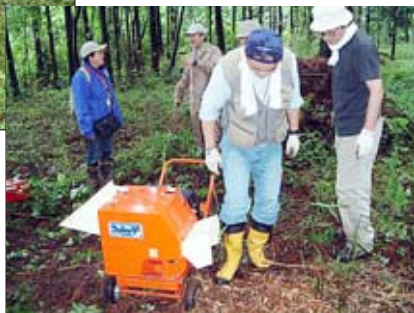
サンダーバード シュレッダーⅡ号